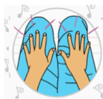
Palmas en muslos