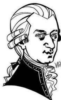
Wolfgang Amadeus Mozart

Toda la información de este video mas la información recolectada en cada clase con cada compositor, será evaluada en la próxima clase sincrónica a través de una prueba virtual, así es que no dejes escapar ningún detalle de toda la información recolectada.